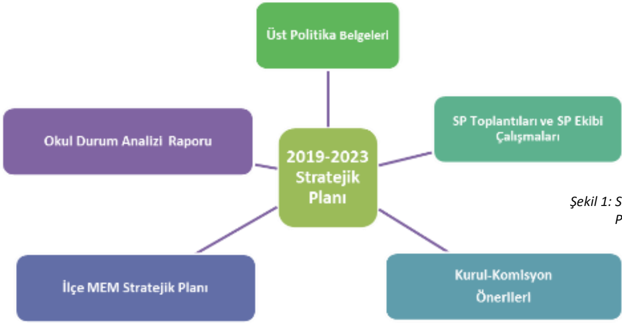
Şekil 1: Stratejik Plan (SP) Oluşum Şeması